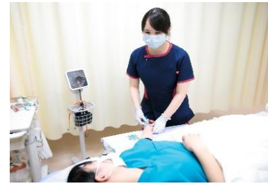
特定行為 医師の指示のもと、看護師が必要な医療をタイムリーに提供する体制を作っています。