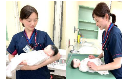
助産師 助産師による外来を週2日開設。妊婦生活の助言や育児技術についての指導をしています。