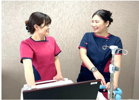
自己完結からパートナーと一緒に