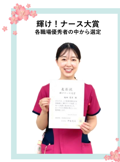
輝け！ナース大賞 各職場優秀者の中から選定

海南病院は住民の皆様から信頼される病院であり続けるために『誠意をもって善意を尽くす』を基本姿勢に取り組んでいます。チーム医療を展開する中で、私たち看護部は個々の役割に誇りを持ち、日々の誠実な努力によって看護の質を高めていきたいと考えています。看護部は組織役割の中で、知識・技術だけでなく、看護師一人ひとりが患者さんに向き合い看護実践できるような相互教育により、個々の成長を支援していきます。『あなたに出逢えてよかった』と言っていただける存在になれるよう、新人看護師の支援体制を整え急性期病院の看護師として活躍を期待しています。