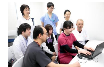
感染管理認定看護師 医師や薬剤師、検査技師など他職種とのチームで感染対策に対する活動も行っていきます。