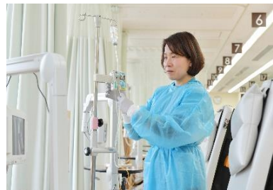
がん化学療法看護認定看護師 副作用の予防法の伝授から精神面まで、患者さんをしっかりサポートします。