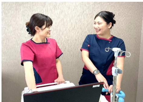
自己完結からパートナーと一緒に