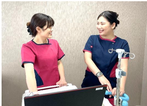
自己完結からパートナーと一緒に